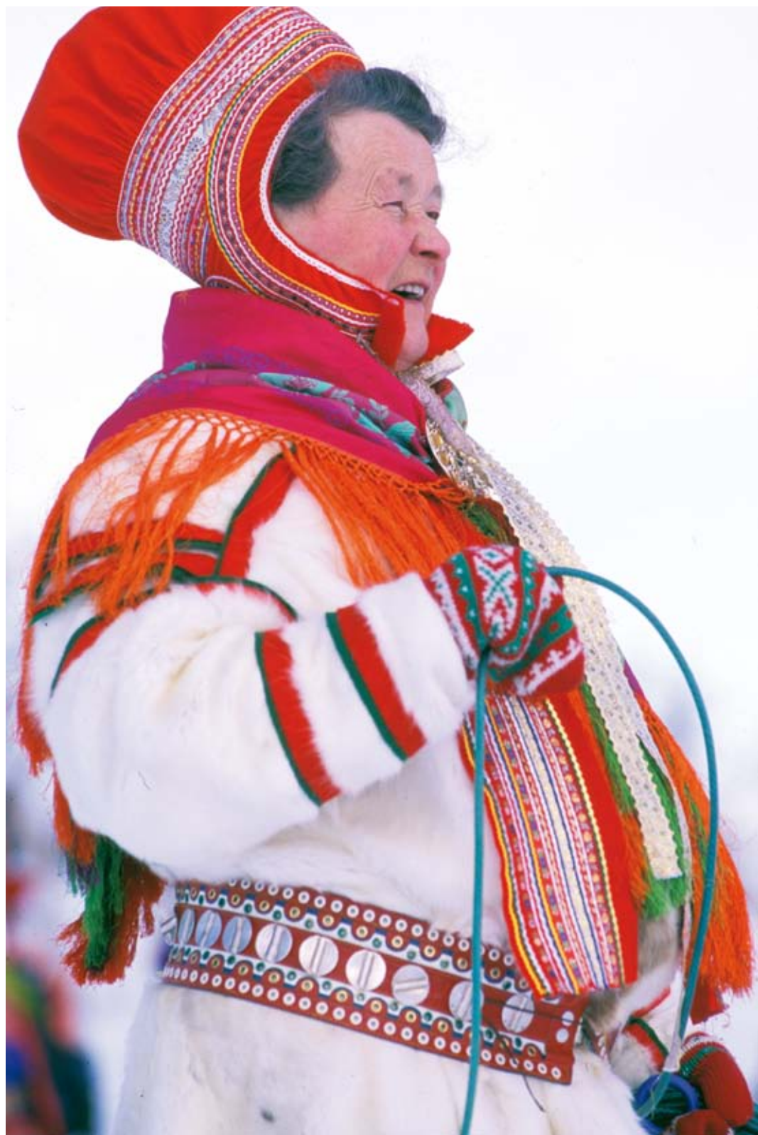
Samisk kvinne. Påskefeiring i Kautokeino.