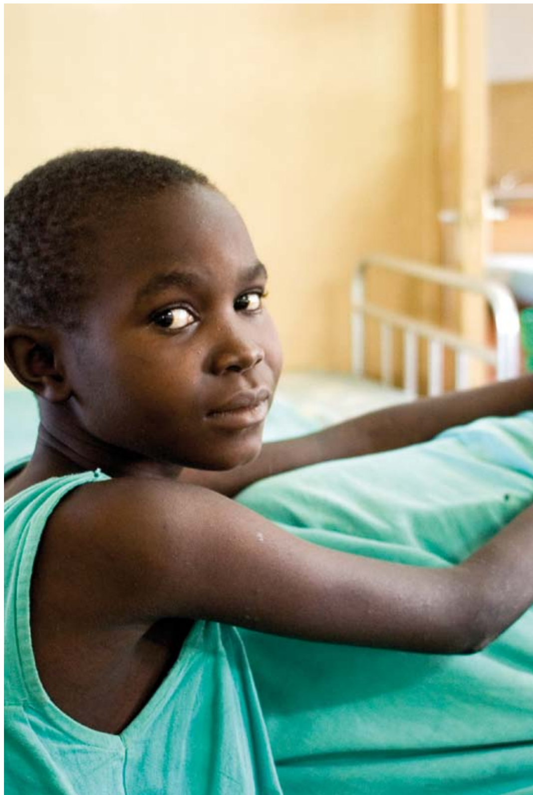
Helsehjelp til barn som har flyktet fra LRA fangenskap, Nord-Uganda