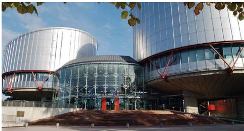
Den europeiske menneskerettighetsdomstolen.

herunder ratifisere EMK protokoll 14, iverksette tiltak for å forebygge og reparere menneskerettighetsbrudd nasjonalt samt bedre etterlevelsen av EMDs dommer.