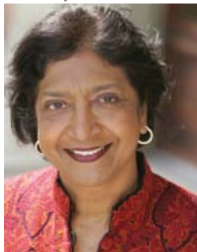
Navanethem Pillay

FNs høykommissær for menneskerettigheter (OHCHR) har flere oppgaver. Høykommissæren er bl.a. FN-systemets sekretariatet for menneskerettighetsorganene som er opprettet for å overvåke statens gjennomføring av menneskerettighetskonvensjonene. Kontoret skal videre koordinere og arbeide for å styrke menneskerettighetsarbeidet i FNs øvrige organer, organisasjoner og enheter.