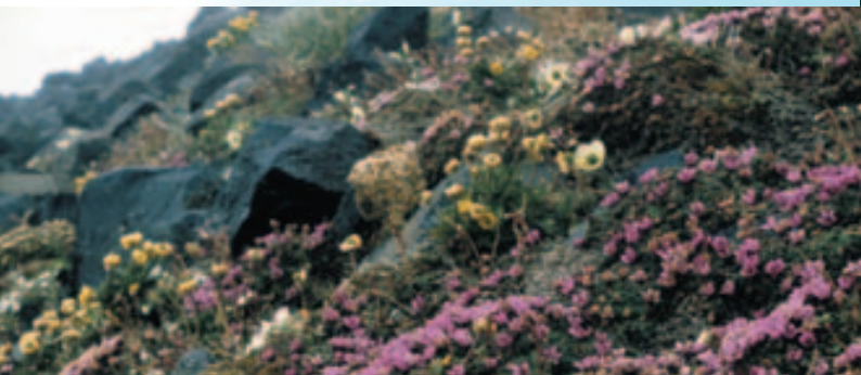
Om sommeren er det et unikt og rikt planteliv på Svalbard. Bildet er tatt på Kongsøya.