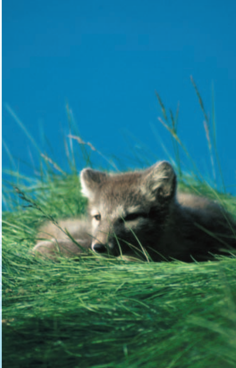
Fjellrev i sommerpels.

Svalbard skal framstå som et av verdens best forvaltede villmarksområder. Samtidig skal Svalbards unike villmark både brukes og oppleves. Ferdseien må derfor skje varsomt slik at kvaliteten eller omfanget av områdene ikke reduseres. Gjennom prinsippet om at «miljøpåvirker betaler» vil ulike miljøgebyrer sikre finansiering av tiltak som beskytter både naturmiljø og kulturminner på Svalbard.