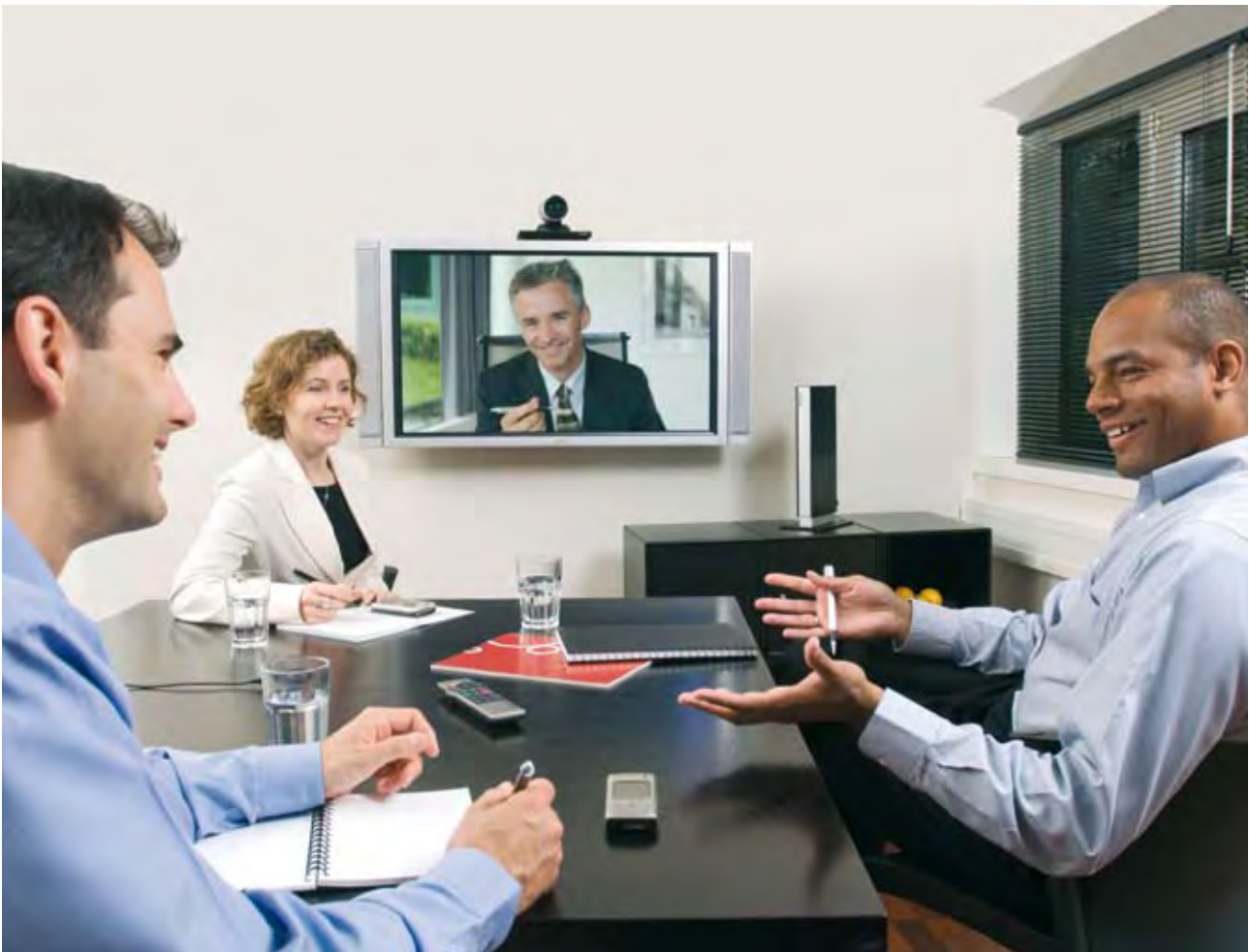
Det er et mål at miljøbelastningen knyttet til offentlige anskaffelser minimeres, her fra en videokonferanse.