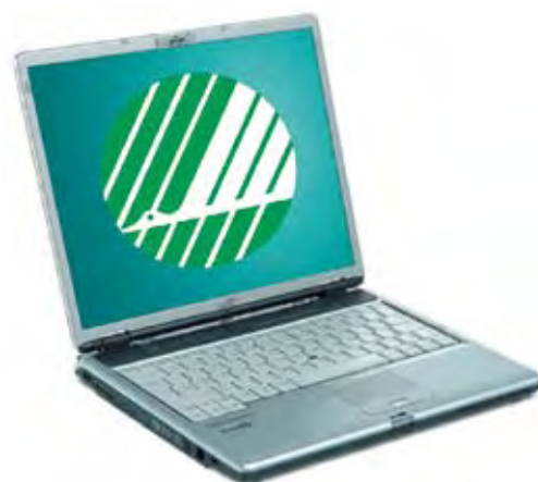
Eksempel på svanemerket PC.

Kravet til kontormøbler og -rekvisita, renhold og hoteller omfatter så mange produkter at det ikke er mulig å gi noen særskilt vurdering. Det skal utarbeides veiledende kriterier som hjelper innkjøpere å ta gode miljøvalg og gode økonomiske beslutninger.