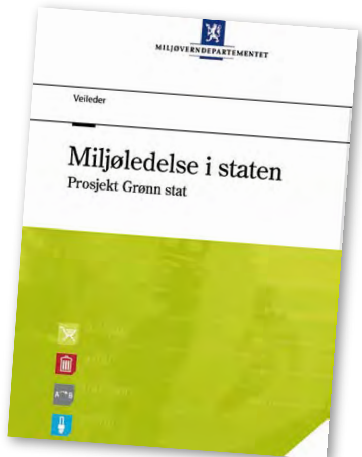
Miljøveilederen: Grønn stat, en veileder for miljøledelse i staten.

Krav til miljøledelse og innkjøp skal i de kommende tre år følges opp gjennom tildelingsbrevene til underliggende etater, og hvert departement har ansvar for å følge opp sine underliggende etater. Dette skal også forankres i stortingsdokumenter som bl.a. statsbudsjettet.