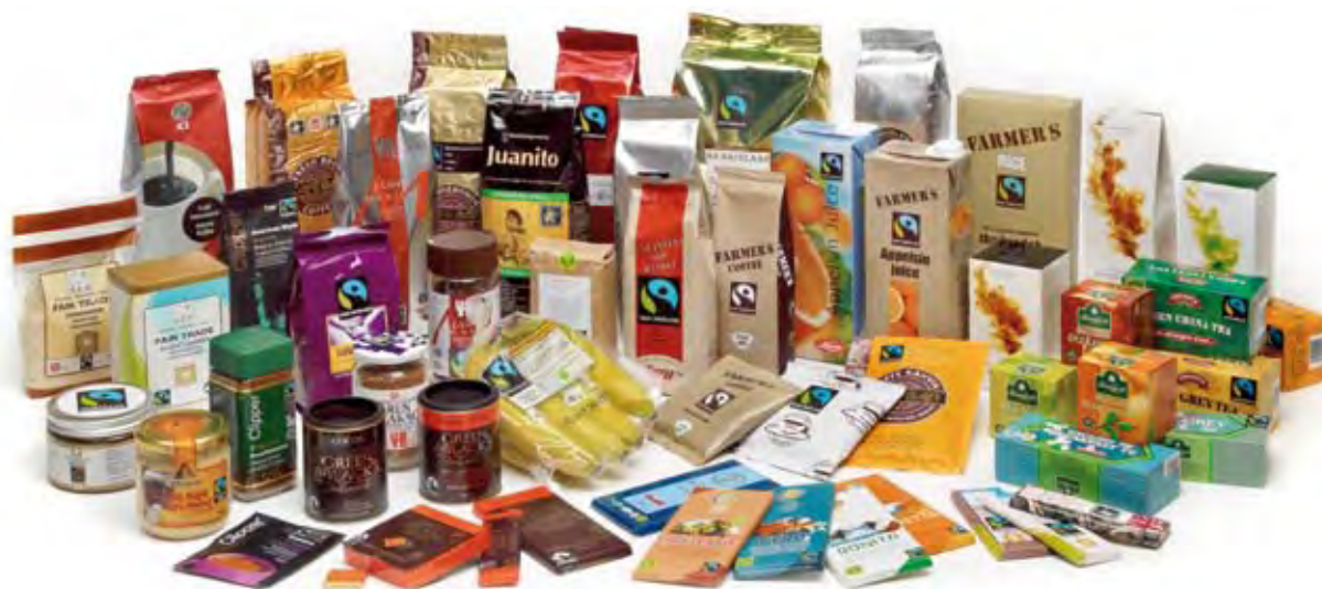
Varesortiment i Max Havelaar-produkter.

Energi og ressursbruk, utslipp og avfall har en rekke koblinger til bedriftsøkonomiske aspekter. Miljø og økonomi går ofte hånd i hånd når totale kostnader legges til grunn. Miljøvennlige løsninger, f.eks. energieffektive løsninger, har ofte høyere anskaffelseskostnader, men gir kostnadsbesparelser i drift. Det er derfor viktig å ta med i beregningen alle kostnader som påløper gjennom anskaffelsens levetid, fra investering, bruk og til avfall/gjenvinning,