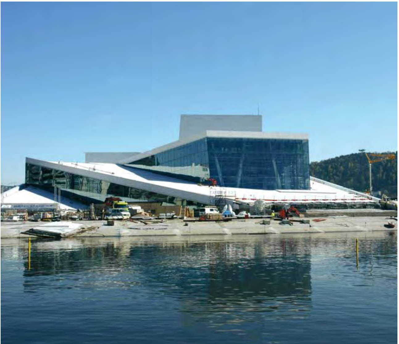
Operaen i Bjørvika.

Ved bygging av den nye operaen i Bjørvika har miljøhensyn vært integrert i prosessen fra starten av. Det skal bl.a. satses på energieffektivisering, og operaen vil få Norges største solcellepanel. Statsbygg er byggherre og har ansvaret for at miljøhensyn blir ivaretatt. Statsbygg har også ansvaret for å kjøpe inn utstyr til operaen, som interiør, verkstedutstyr, lyd/bilde og IKT. Her har man fastsatt tre miljømål, hvorav ett er energirelatert. De øvrige målene gjelder kjemikalier, biologisk mangfold, levetid/holdbarhet og avhending.