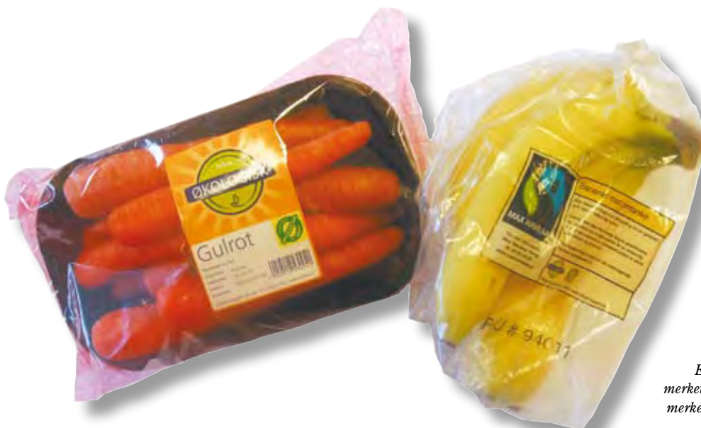
Eksempler på økologiske matvarer merket med Ø-merket og MaxHavelaarmerket for Fairtrade, rettferdig handel.

På disse områdene bør andelen offentlige anbud og innkjøp med relevante miljøkrav øke betydelig de neste tre årene.