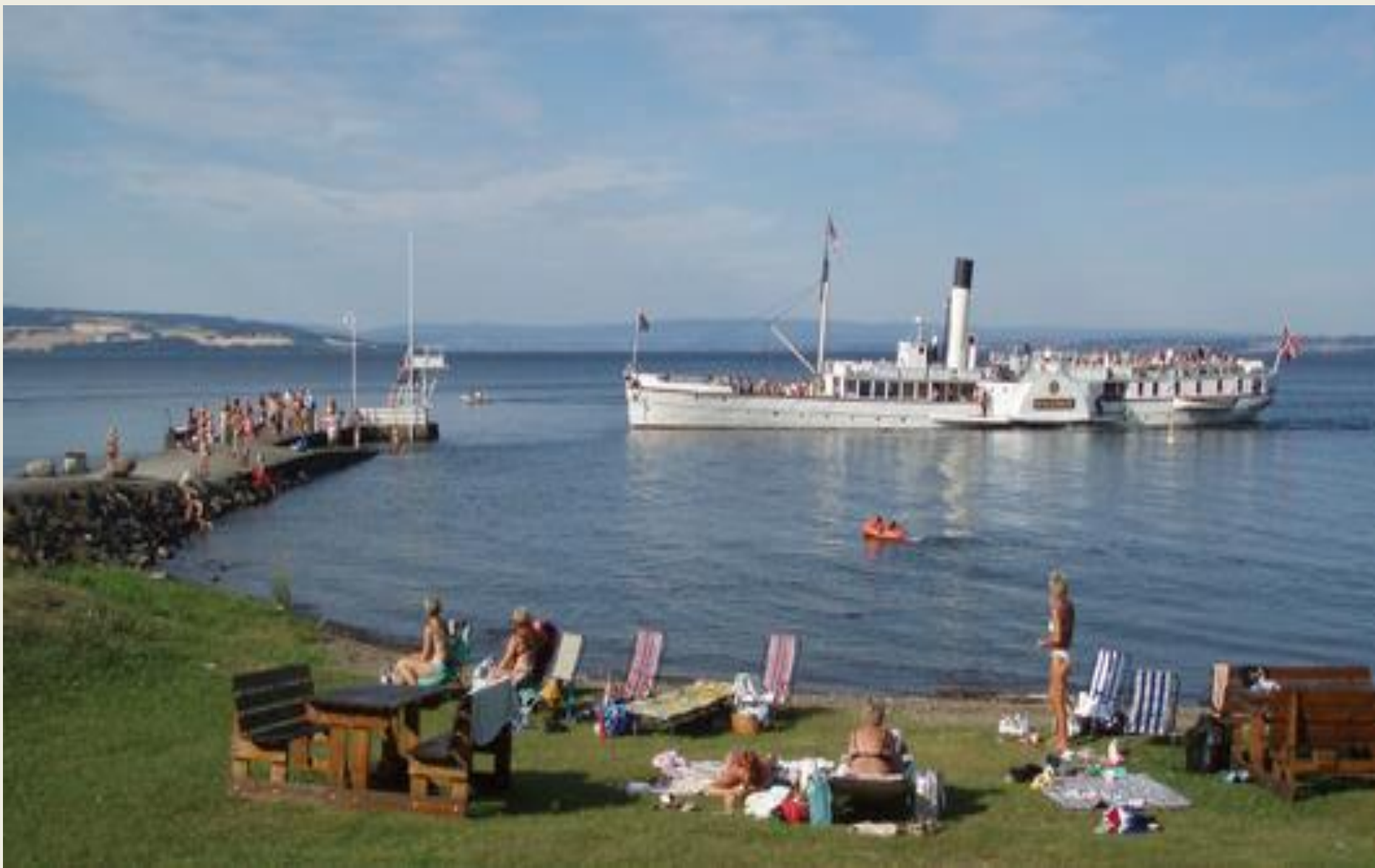
Verdens eldste hjuldampner i drift, Skibladner, går i rute på Mjøsa hele sommeren.