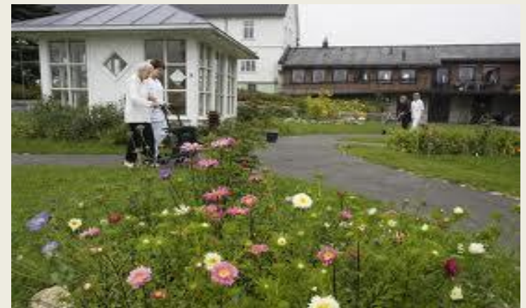
Arbeidsmiljøprisen gikk i fjor til Fjellvoll bo - og servicesenter.