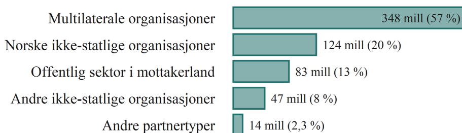
Type partner, øremerket bistand til Palestina i 2019

I 2019 ble mest av den øremerkede bistanden til Palestina gitt gjennom Multilaterale organisasjoner (348 mill), Norske ikke-statlige organisasjoner (124 mill) og Offentlig sektor i mottakerland (83 mill).