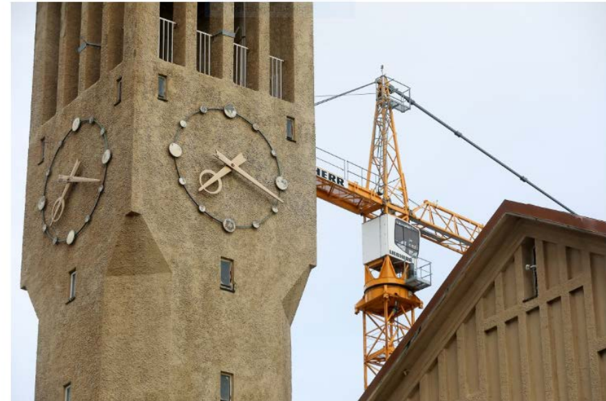
Nye Bodø Rådhus under oppføring.