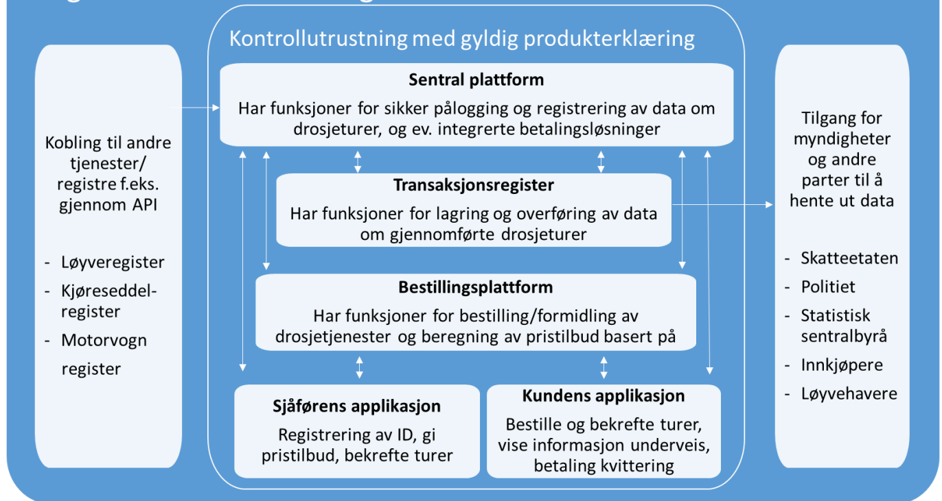
Figur 1: Skisse av potensiell løsning for kontrollutrustning

Sentral plattform i dette eksempelet er en teknisk plattform som har sikre funksjoner for å: