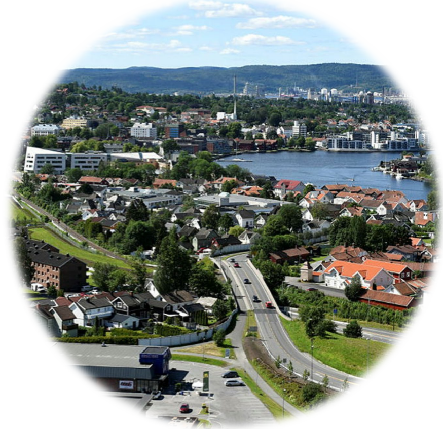
Hovenga, Porsgrunn