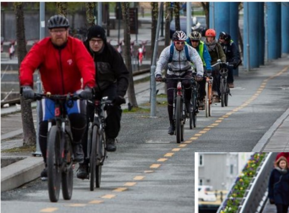
SYKKELTOG. Reisevaneundersøkelsen for 2018 viser at en av landet.