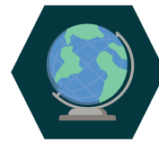
Anvendelse av digitale teknologier