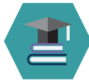
Avansert digital kompetanse