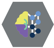
Sky, data og kunstig intelligens