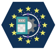
Tungregning og superdatamaskiner

Norge deltar i Programmet for et digitalt Europa (DIGITAL), EUs investerings- og kapasitetsbyggingsprogram for digital omstilling og bruk av innovative digitale teknologier i samfunn og næringsliv.