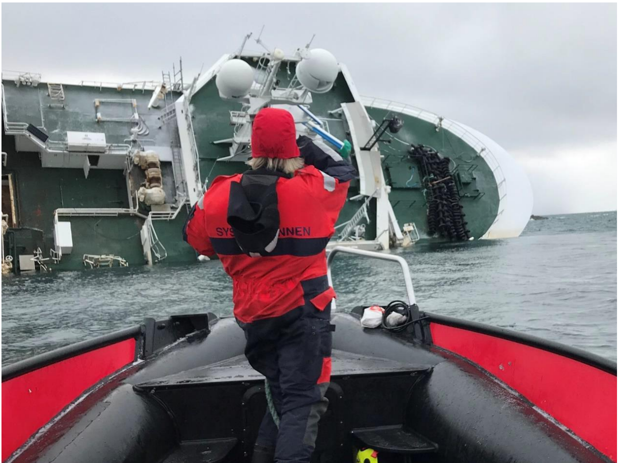
Syssemmannen har bistått i forsøket med bergingen av Northguider.