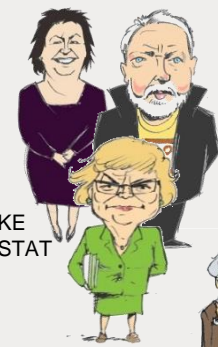
FYLKE OG STAT