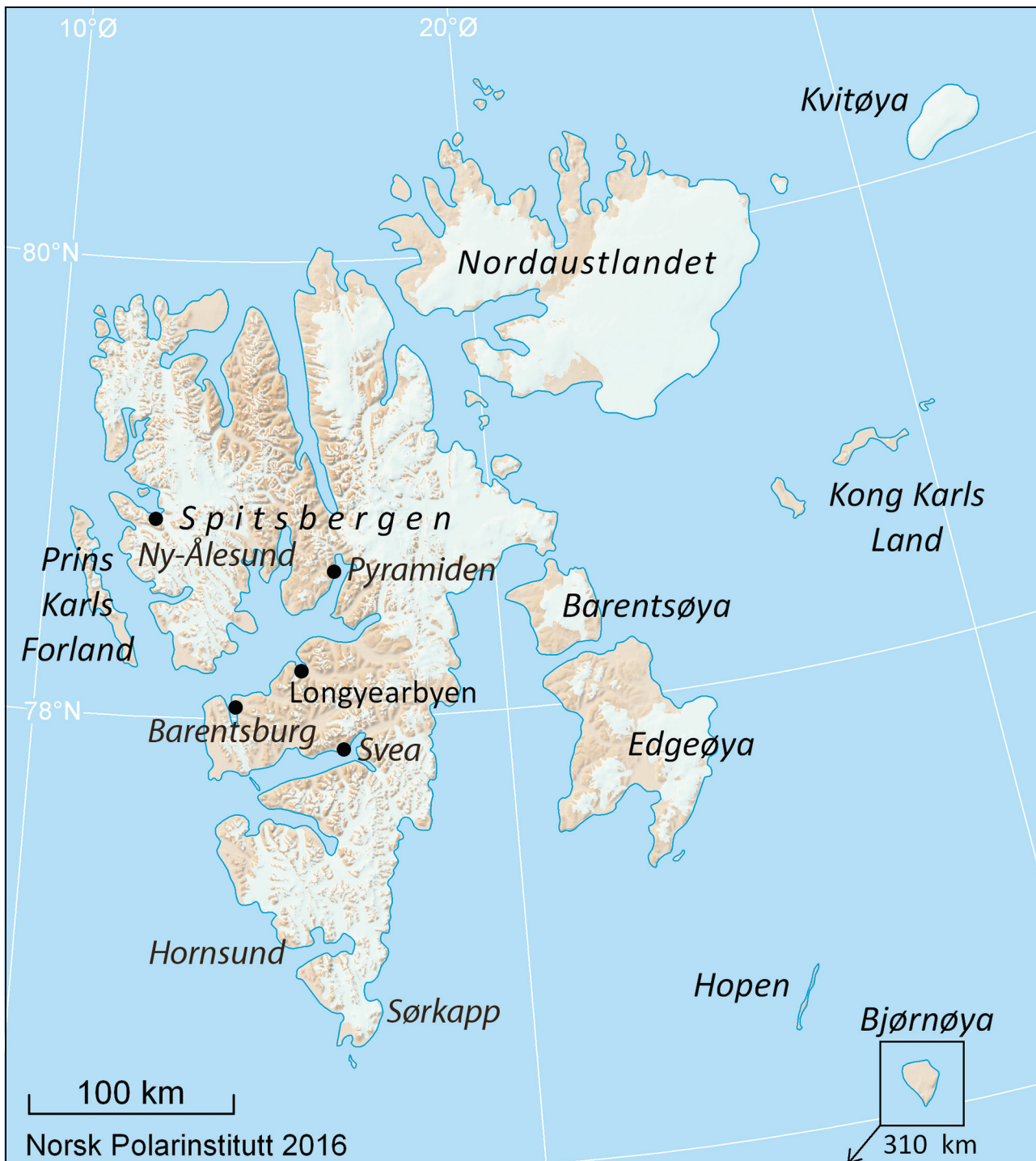
Figur 3.1 Kart over Svalbard