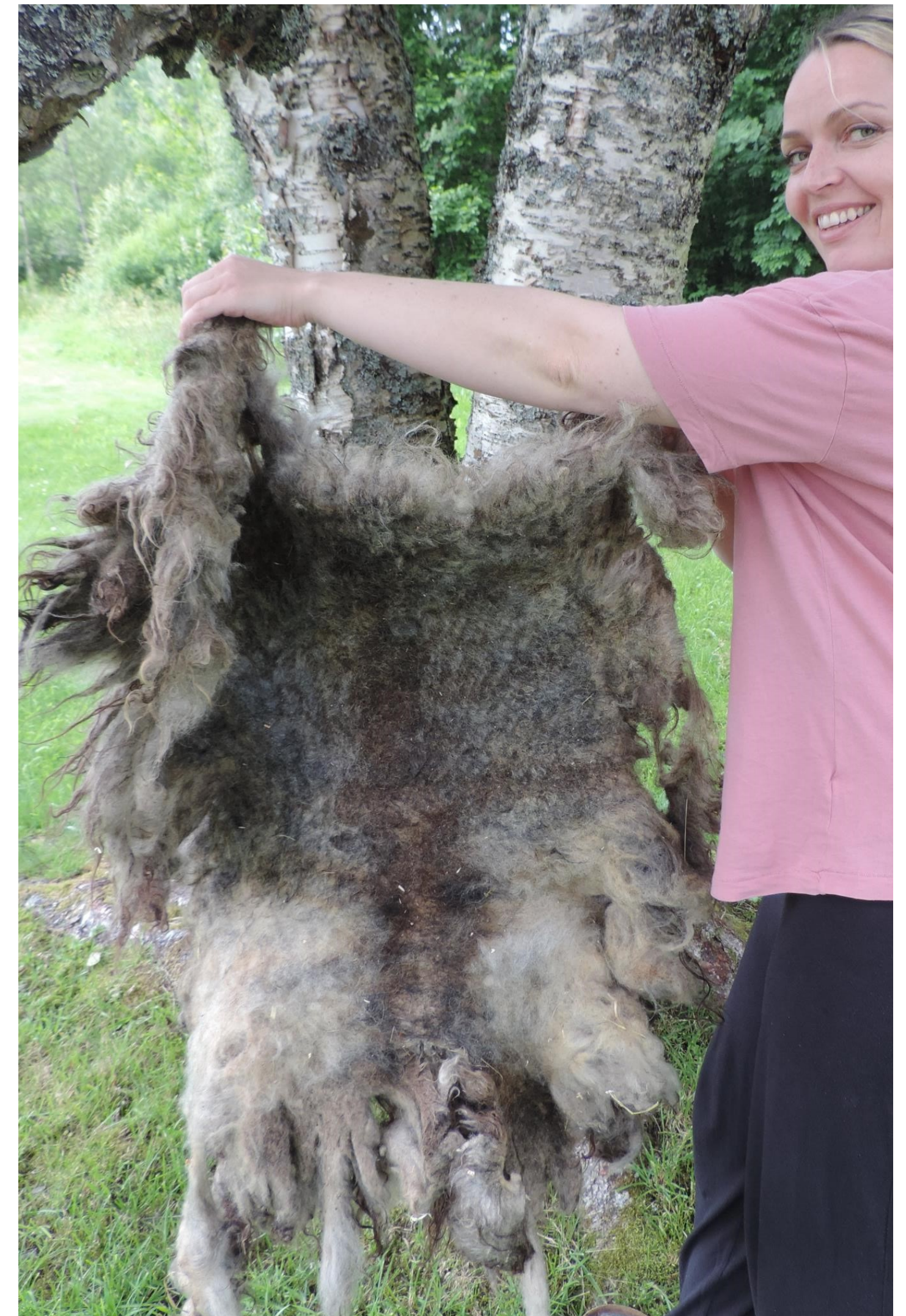
Helårsull fra gammelnorsk sau