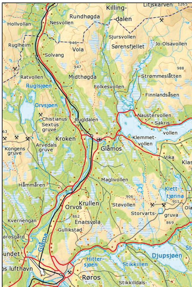
Figur 1.2 Sametinget har i 2013 støttet stedsnavnprosjektet «Kartlegging og dokumentasjon av samiske stedsnavn i Rørosregionen».

Prosjektet går ut på å kartlegge samiske stedsnavn og informasjon om hvorfor de benevnes som de gjør. I sørsamiske områder er det tidligere samlet inn lite samiske stedsnavn, og dette prosjektet anses derfor som meget viktig arbeid. Innsamling av samiske stedsnavn er viktig for å få disse mer synlig i områder der det tidligere ikke er foretatt noe særlig innsamling av samiske stedsnavn, og hvor det er stort behov for at samisk språk bevares og styrkes. Innsamling og registrering av samiske stedsnavn er en god måte å få synliggjort det samiske språk på i disse områdene, spesielt da navnene forhåpentligvis kommer til syne i kart og vegskilt. Det er bevilget kr 300 000 til prosjektet.