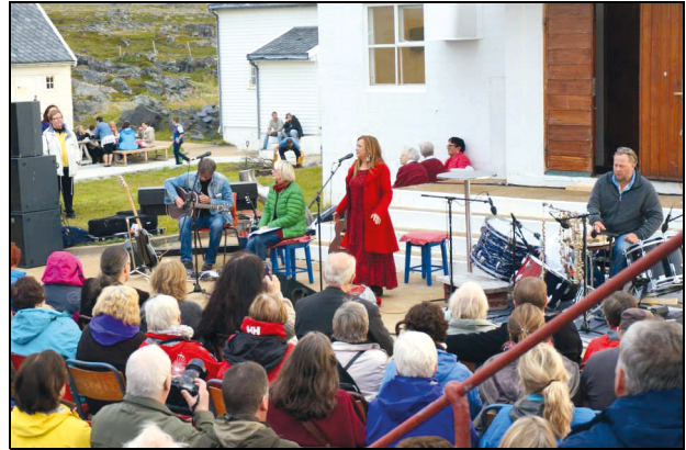
Figur 1.3 Kulturdugnad Gamvik 2013. Gamvik kunstforening har hvert år siden 2009 arrangert kulturdugnad Gamvik, en liten festival med et variert spekter av kulturelle uttrykk.

For Sametinget er det viktig å legge til rette for gode rammebetingelser og arbeidsvilkår for skaping og formidling av samisk litteratur, musikk, dans, teater, film, billedkunst, kunsthåndverk og