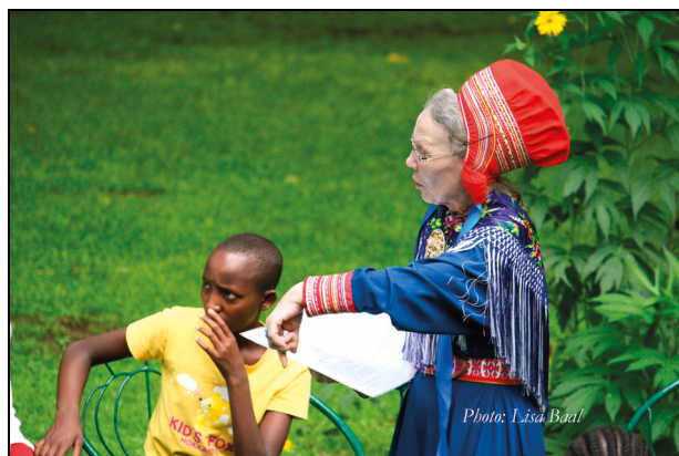
Figur 1.10 Mama Sara Education Foundation er en samisk bistandsorganisasjon som gir bistand til urfolk fra urfolk.

Sametingets økonomiske virkemidler til internasjonalt arbeid hadde i 2013 en budsjetttramme på kr 6 408 000. Av dette var det kr 838 000 i direkte tilskudd, kr 570 000 i søkerbaserte tilskudd, samt 5 millioner kroner til forberedende konferanse for verdenskonferansen for urfolk 2014 (WCIP 2014).