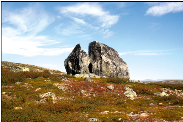
Figur 1.6 Lappesteinen i Hol kommune i Buskerud.

På starten av 2014 vil eiere av de registrerte bygningene motta brev om konklusjonen rundt bygningene og en orientering omkring om hva det innebærer å eie en fredet samisk bygning. Feltsesongen i 2014 vil primært ha fokus på samiske bygninger i Nord Troms.