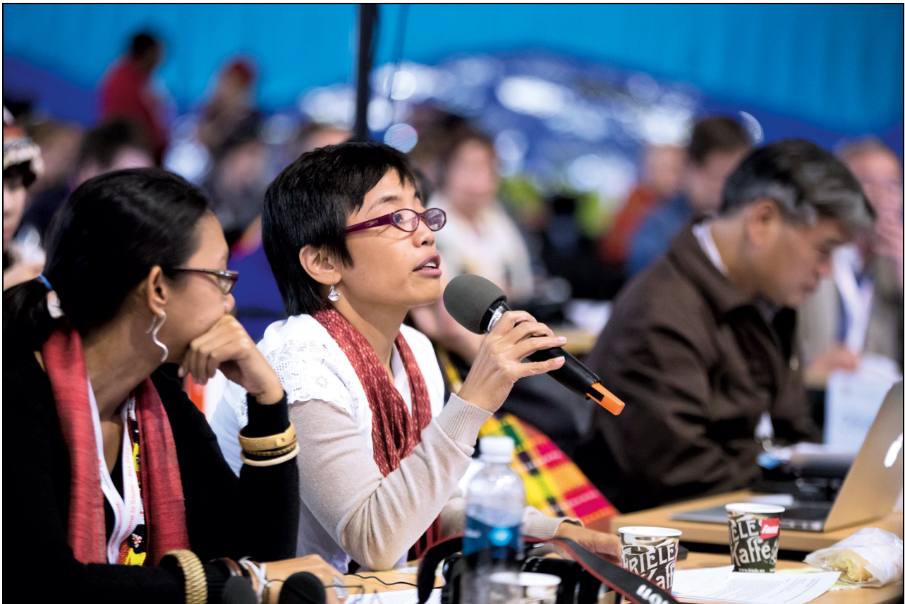
Figur 1.11 Fra ÁLTÁ 2013.

Sametingets internasjonale representant presenterte Alta-dokumentet for FNs medlemsstater i New York den 2. juli 2013, og redegjorde for Alta 2013 og prosessen forøvrig. Møtet var organisert