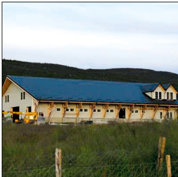
Figur 1.8 Vang gård har fått kr 212 000 i tilskudd til investering i et helautomatisk foringsanlegg.

Anlegget vil forenkle foringen betraktelig og vil også gjøre det enklere å få tak i avløsere. Karlsøy kommune er en av de nye STN-kommunene.