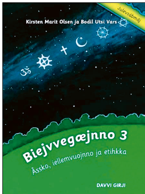
Figur 1.5 Boka er en lærebok i RLE på lulesamisk og er en del av lærebokserien som er tilpasset 1.–4. trinn.

I 2013 fikk Sametinget søknader om tilskudd til produksjon av samiske læringsressurser for