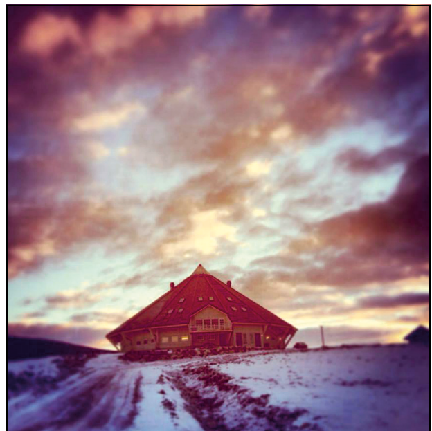
Figur 1.7 Bull gård og Vang gård i Karlsøy kommune åpnet i august 2013 sine nye landbruksbygg gjennom prosjektet Barentsfjøs.

Gjennom jordbruksavtalen mottok Sametinget i 2013 midler til satsing på arktisk landbruk. Denne satsingen er nå formalisert. Sametinget er engasjert i dette samarbeidet både i styringsgruppen og tildelingsgruppen, sammen med bondeorganisasjonene og landbruksdirektørene i nord. Det har vært stor interesse for midler til ulike prosjekter innen arktisk landbruk. Prosjekter der Samisk språk, kultur og tradisjoner har vært fremtredende, har uteblitt, noe Sametinget vil jobbe for i 2014. Saker på et overordnet nordnorsk nivå er prioritert.