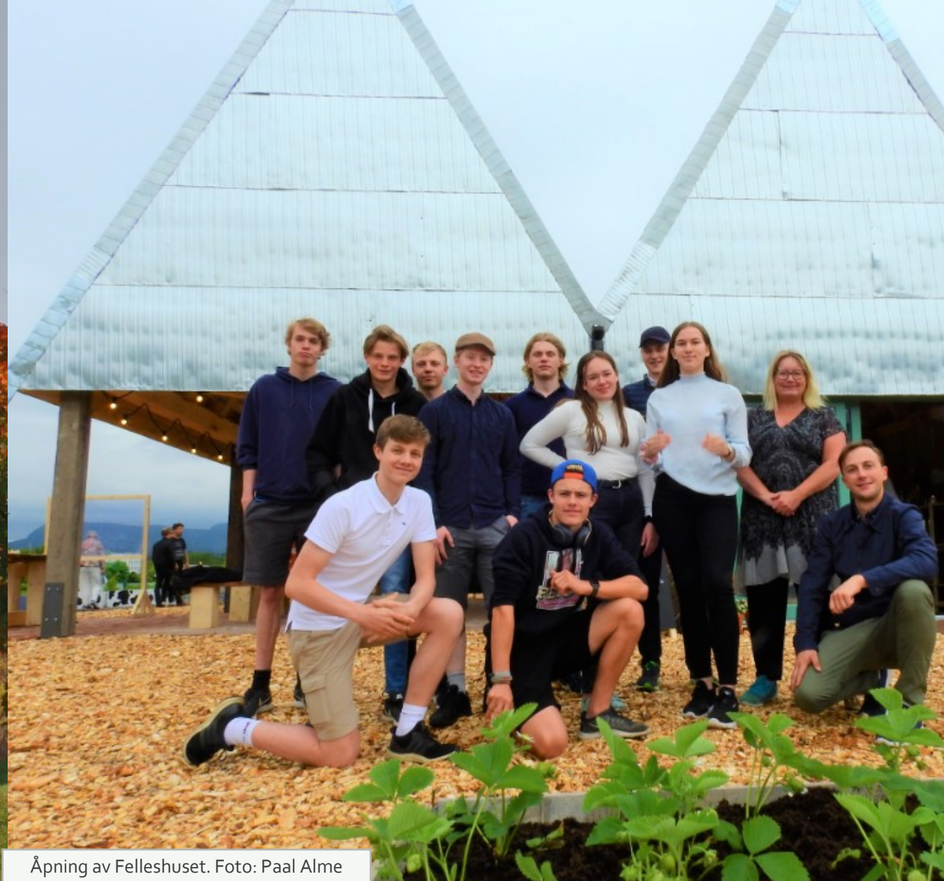
Åpning av Fellehuset.