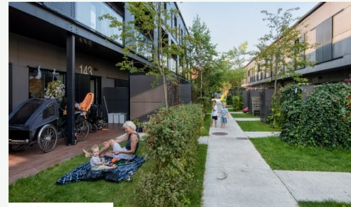
Almenbolig. Kantzoner i København