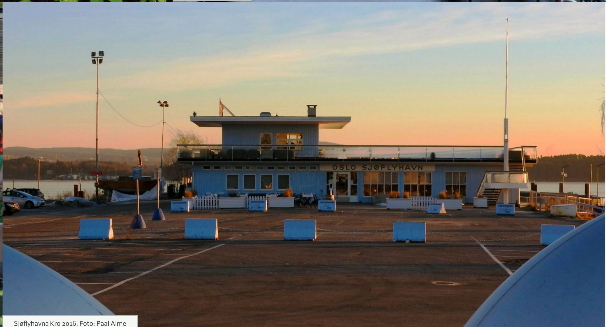
Sjøflyhavna Kro 2016.