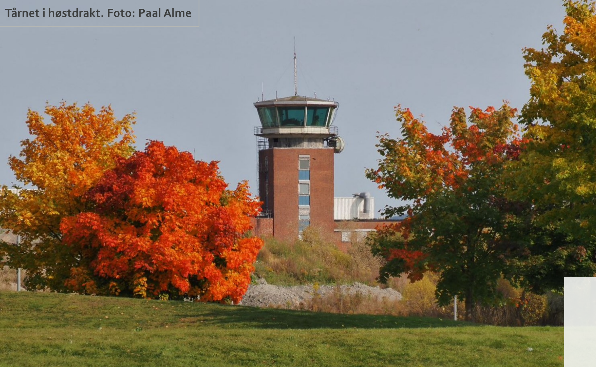
Tårnet i høstdrakt.