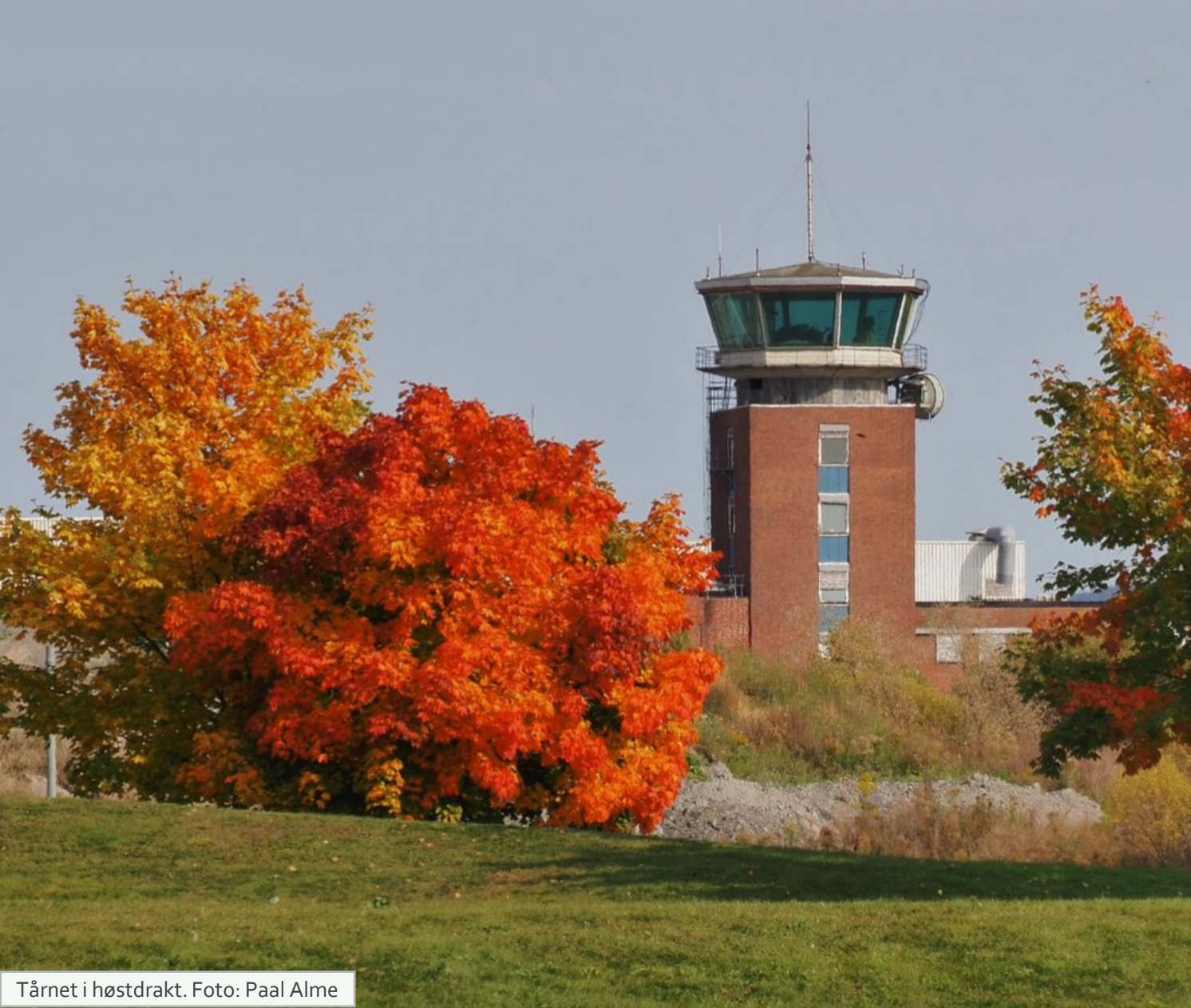
Tårnet i høstdrakt.