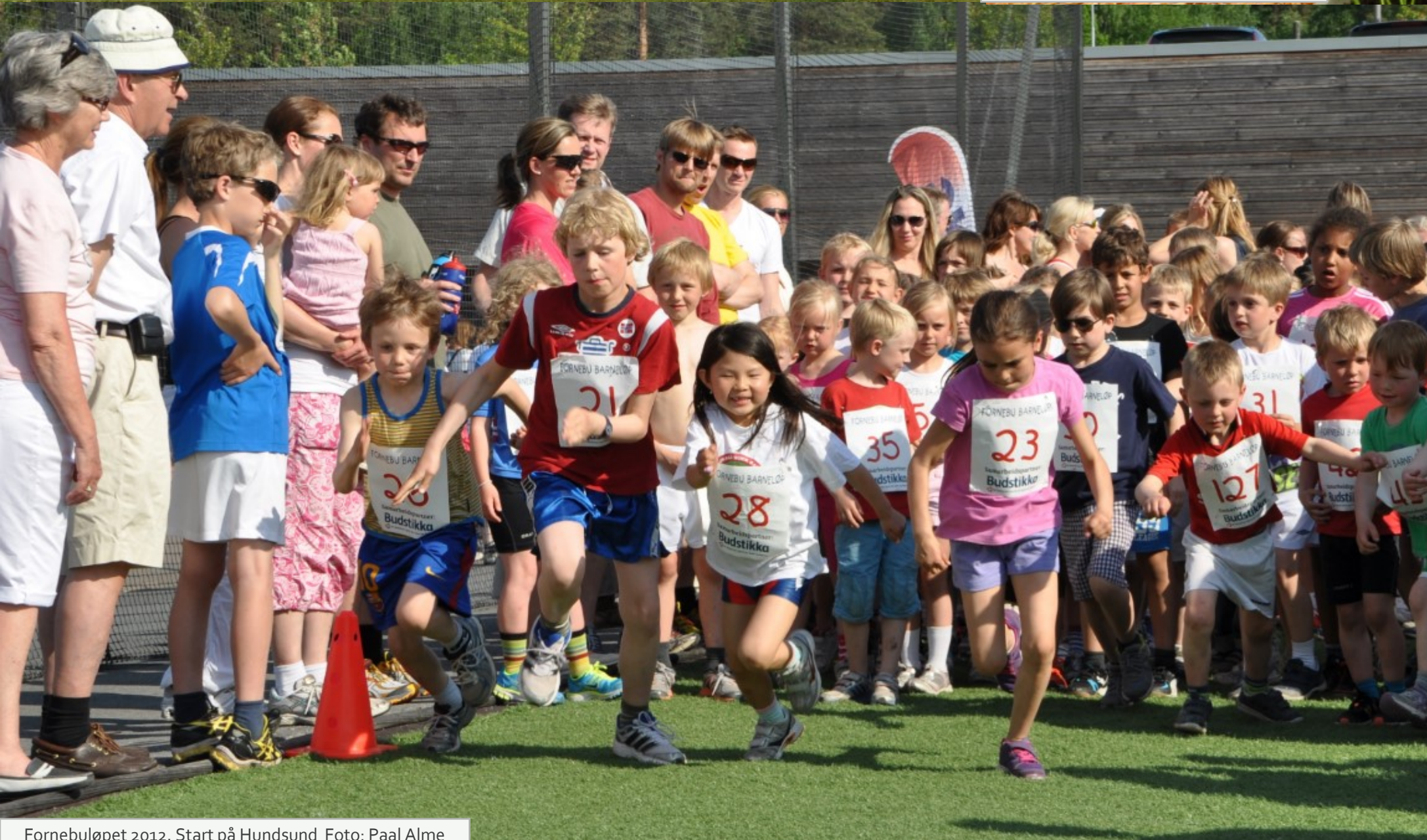
Fornebuløpet 2012. Start på Hundstund