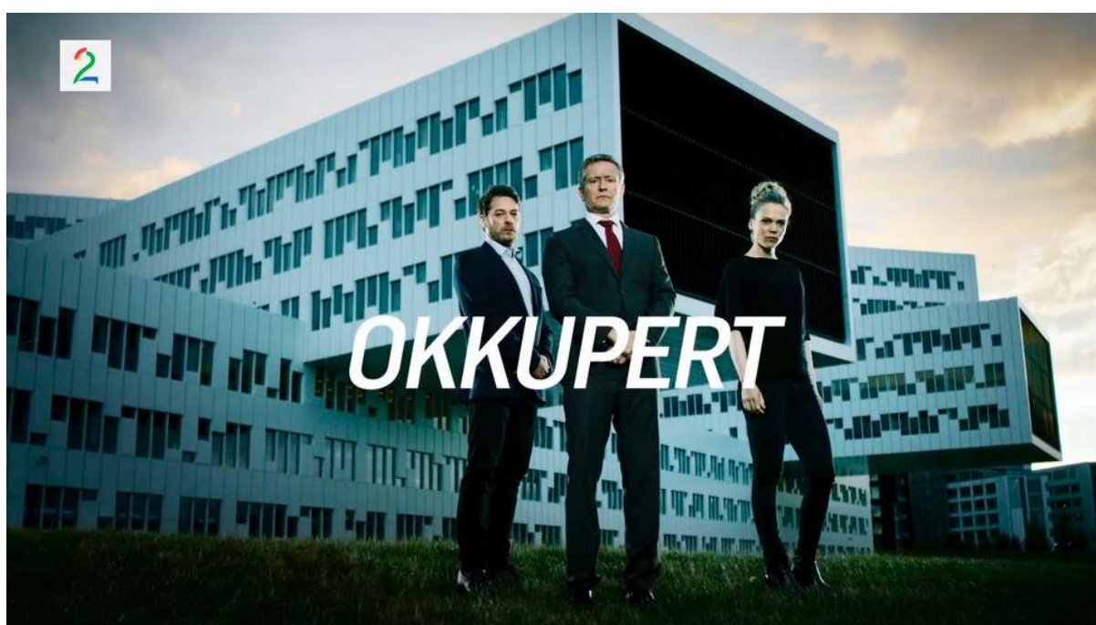
TV 2-serien Okkupert hadde premiere i 2015. Rådet ønsker å styrke finansiering av norske TV-serier ved å opprette et nytt privat-offentlig TV-seriefond.

Rådet ser det som hensiktsmessig at midlene i utgangspunktet fordeles med 70 prosent til TV-drama og 30 prosent til TV-dokumentar, hvorav minst 25 prosent av totale midler skal brukes til programmer for barn og unge (som i Danmark).