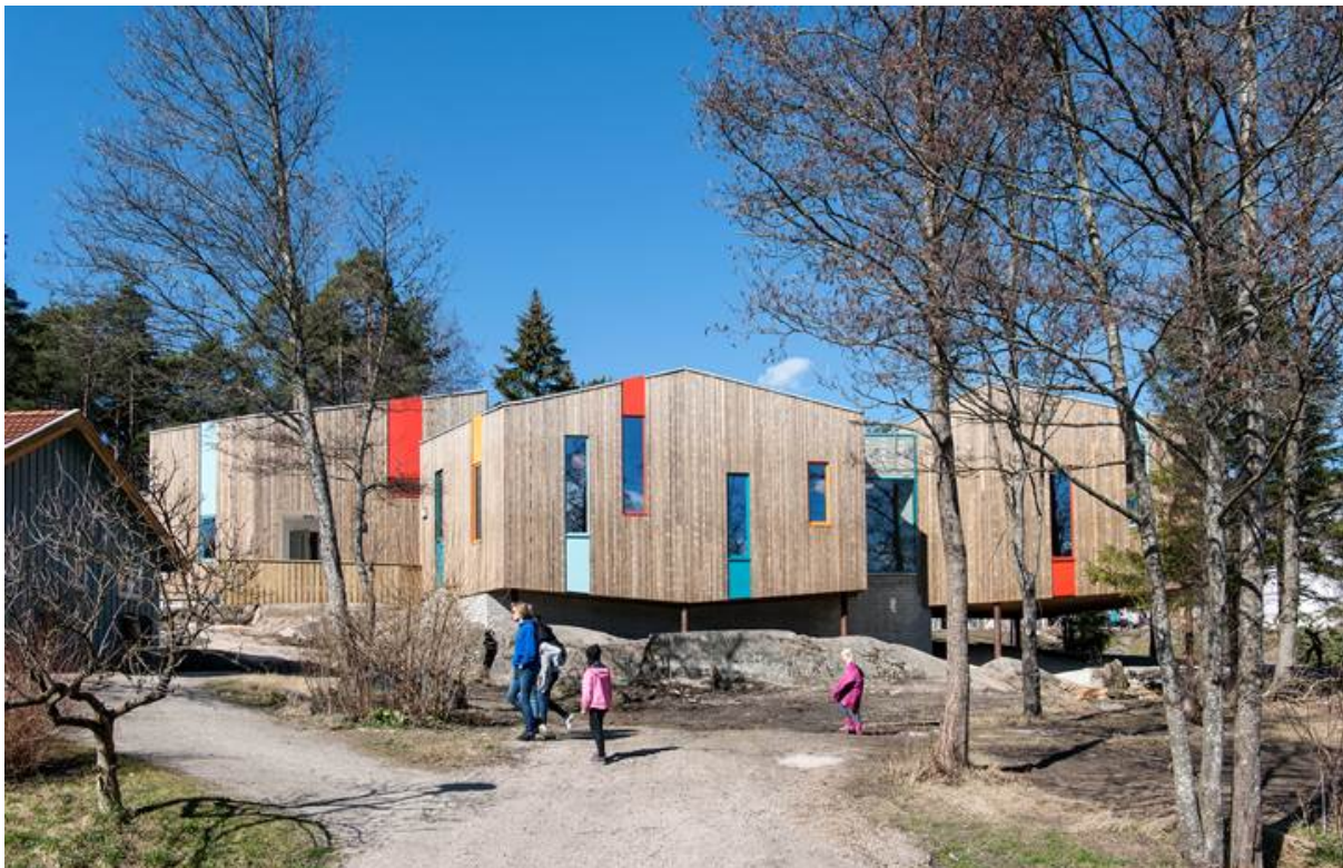
Steinerskolen i Fredrikstad, tegnet av Link Arkitektur.

-Risikopott? Det offentlige har risikovegring, noe som forhindrer bærekraftig innovasjon. Kunne staten/Statsbygg ha en «risikopott» eller en form for forsikringsdekning som trer inn dersom innovasjonen uteblir eller viser seg å bli for dyr? Dette punktet må dog utredes mer.