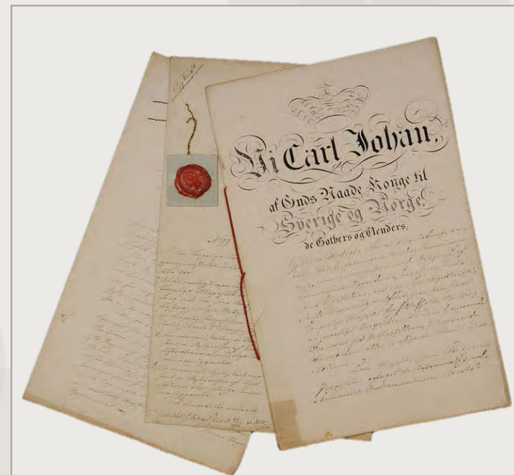
Kongelig proposisjon til lov om formannskaper.