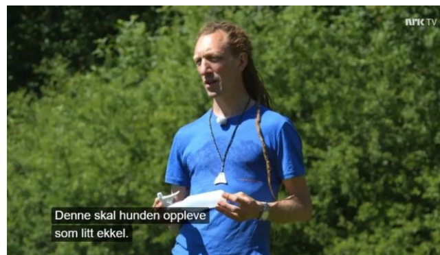
Bruk av sprutflaske mot hund i NRK

Dette er særlig skadelig fordi disse programmene appellerer til barn og nye dyreeiere som ikke har annen referanseramme