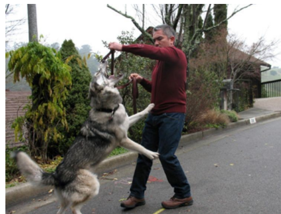
Strangulering som løsning i atferdsterapi, TVNorge.