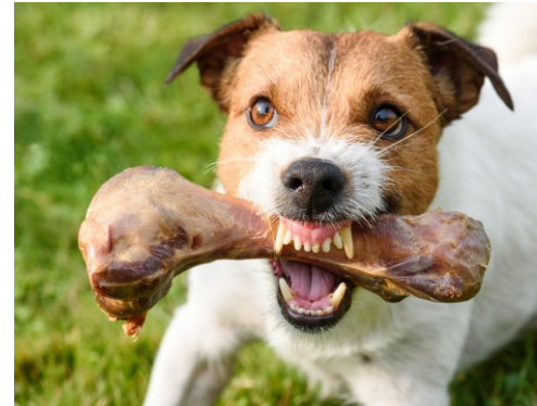
Feil håndtering gir eskalering og bitt

Aktører som gir lovstridige råd må stoppes