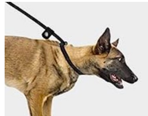
Strupelenke kan gi skader og skal ikke brukes jfr Mattilsynet