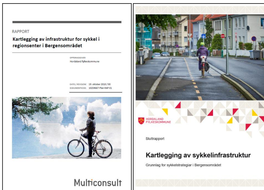
Figur 1 og 2: Prosjektet har resultert i ein kartlegging utført av Multiconsult, samt ei sluttrapport frå prosjektgruppa. Sistnemnde er i sluttspurten av publisering.

Vi har i tillegg valt å utarbeide en større rapport som skal brukast i vidare arbeid administrativt og politisk for å fremme interesse for sykkelutbetring. I hovudsak vil rapporten tilrå at kommunane jobbar mot å inngå sykkelbyavtalar og å lage eigne sykkelstrategiar. Ein ser sykkelbyavtalane som viktige for å skape samordning på tvers av vegeigerane og investeringsansvar. Ein ser det slik at samordning vidare er essensielt for å jobbe mot å realisere eit godt og attraktivt sykkelnett.