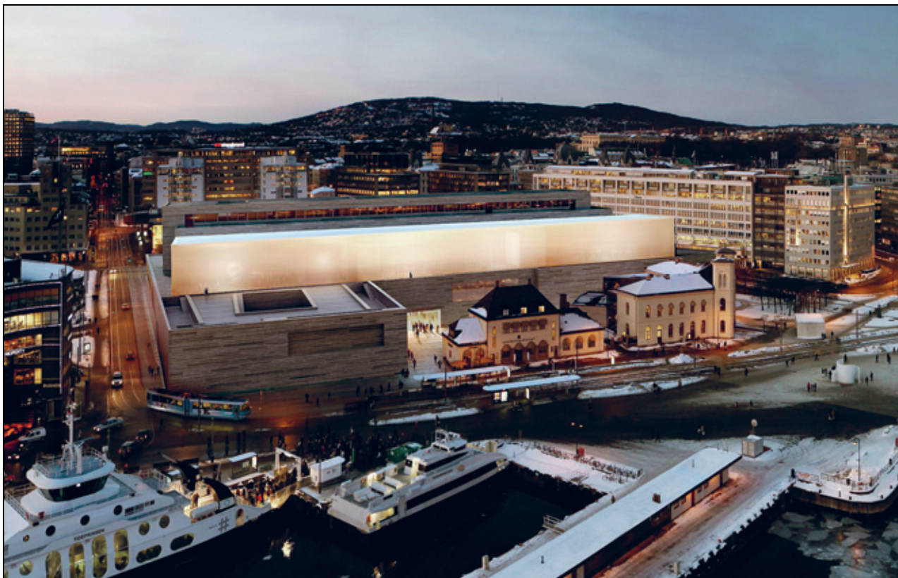
Figur 3.1 Nybygget for Nasjonalmuseet på Vestbanen.

Illustrasjon: Kleihues +Schuwerk Gesellschaft von Architekten mbH, MIR Kommunikasjon AS og Statsbygg.