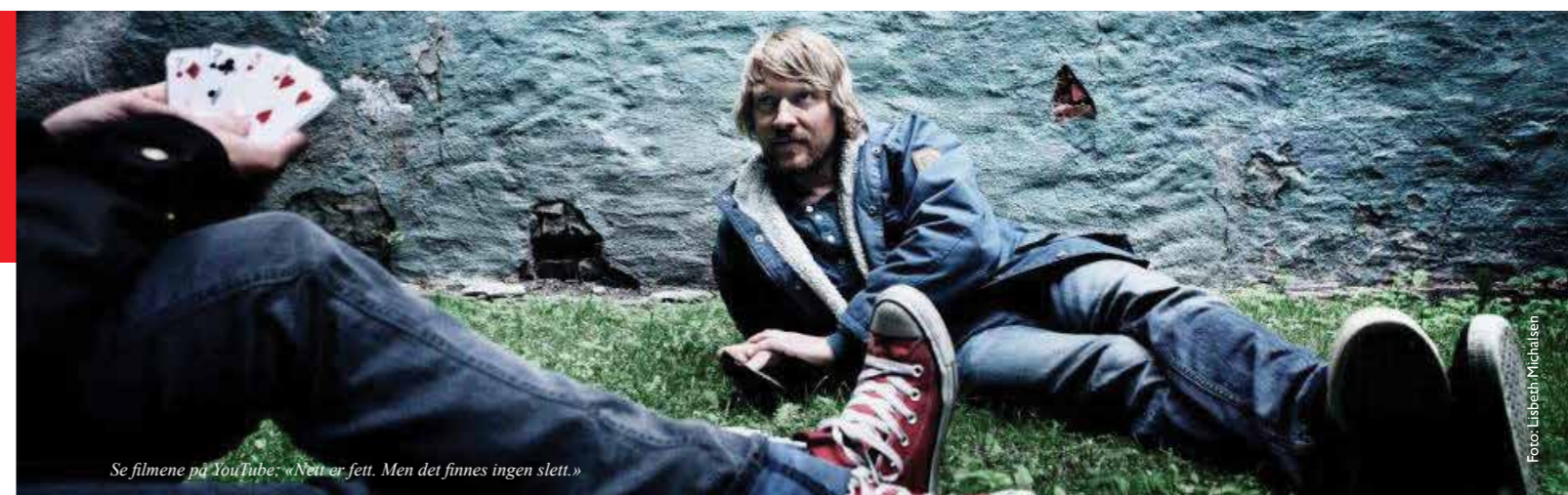
Se filmene på YouTube: «Nett er fett. Men det finnes ingen slett.»

Det er viktig at alle oppvekstarenaer får økt innsikt i unges nettsjargong og at ulike aktører jobber sammen for å skape en mer positiv og ansvarlig nettkultur.