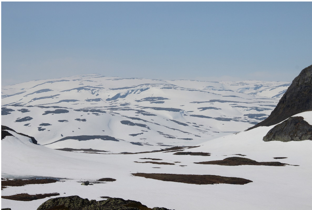
Fig. 2. Foto teke 3. juli 2015 frå Holkaslaet mot sørvest, med Storekoll i bakgrunnen. Det er framleis svært lite berrmark.